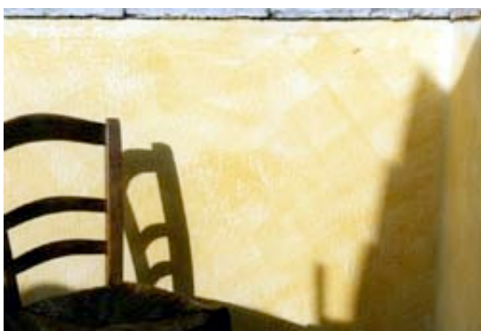
Pose en chevron volontairement marquée