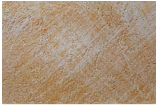
Usure artificielle à la brosse métallique