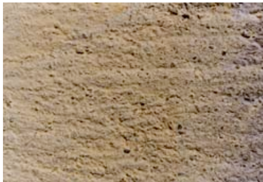
Une couche d'eau forte laisse voir en transparence la texture de l'enduit.

L'eau forte (4 à 6 vol d'eau / 1 vol de chaux en poudre) Elle convient aux supports très poreux. Elle couvre moins vite le grain du sable et permet du coup des effets de transparence avec la texture du support.