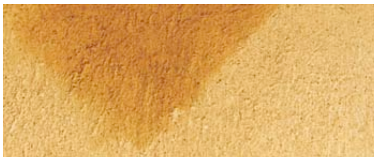
Le support est favorable s'il est poreux (l'eau le mouille sans couler).

En appui de baie, surtout en milieu urbain, le badigeon se salit quand la pluie entraîne la poussière déposée. On devra le renouveler.