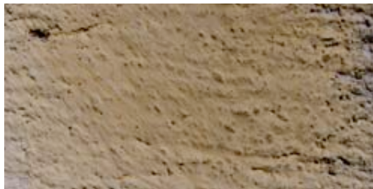
Le badigeon masque le grain de l'enduit

on évitera les périodes chaudes et ventées, on humidifiera le support la veille et on l'adjuvantera en colle.