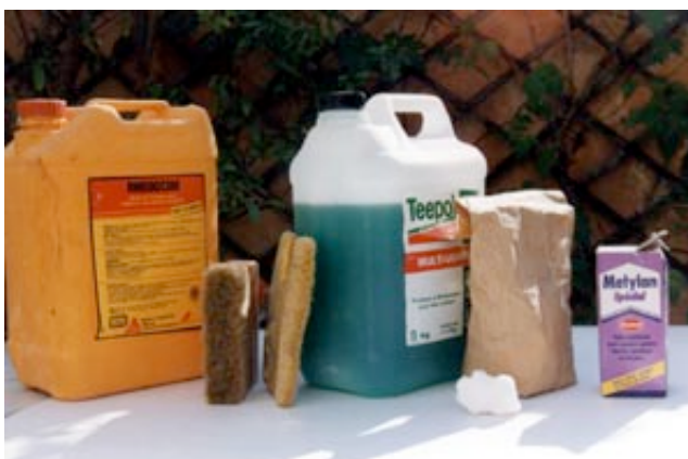
ADJUVANTS : Résine / Teepol / Sel d'alun / Colle à papier peint.

On peut à l'avance : préparer la colle dans de l'eau froide pour ne pas avoir de grumeau et faire fuser les oxydes avec le teepol dans de l'eau (c'est inutile avec les terres colorantes).