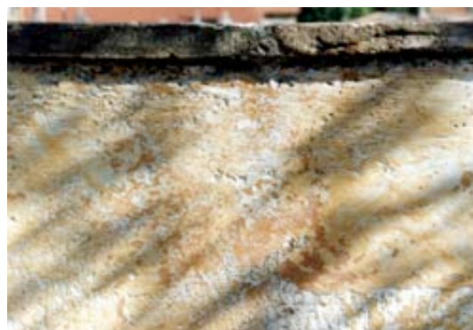
Effet de vieux badigeon par superposition de 3 couleurs (usées entre couches par brossage)

On peut réaliser 3 couches de teintes différentes en brossant à la brosse métallique pour faire apparaître les couches de dessous.