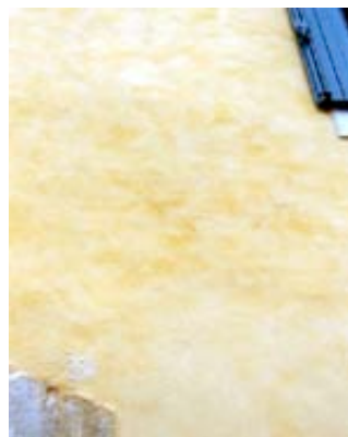
Badigeon et patine

On applique 2 couches couvrantes sans rechercher d'effet. On laisse sécher 2 à 4 heures. On applique une patine à 20 volumes d'eau pour 1 volume de chaux. On formule la patine avec un % de colorant 2 à 4 fois plus fort par rapport au poids de chaux. On applique de petites touches croisées (mouvement du poignet) sans tirer la brosse et en prenant soin de l'essuyer au bord du seau pour ne pas laisser de traces trop fortes.